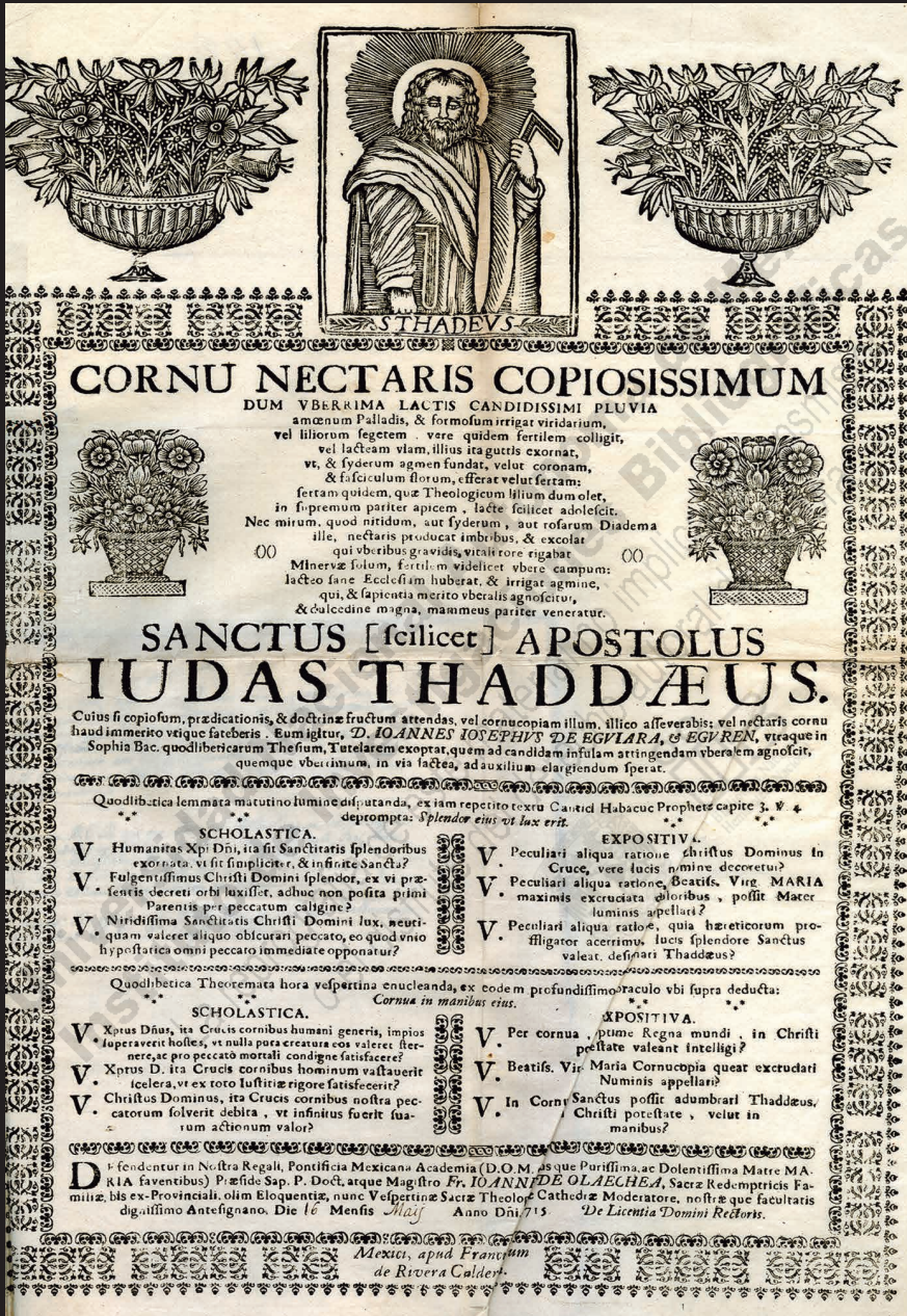
Fig. 1. Convocatoria para la defensa de quodlibetos Cornu nectaris del día 16 de mayo de 1715, Ms. 328, fol. 149r