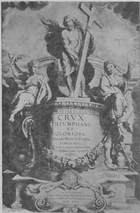
El Triunfo de la Cruz.