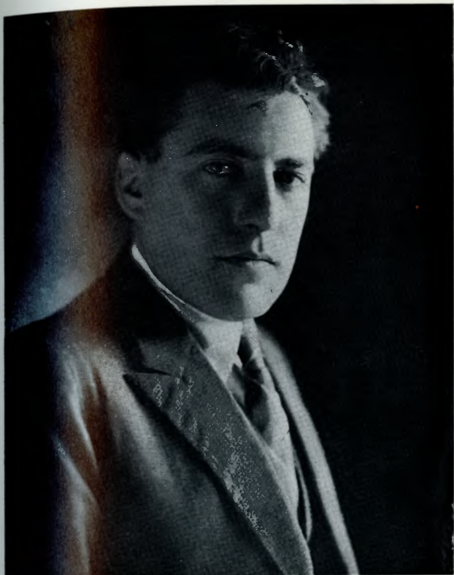
Martín Luis Guzmán (6/XII/1914-19/III/1915)