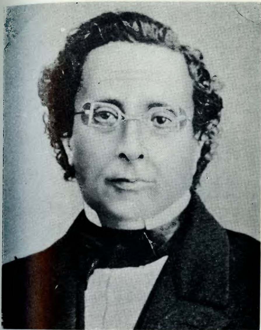
José María Lafragua (XI/1867-15/XI/1875)